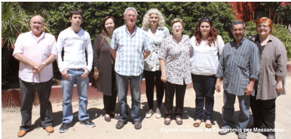
Alguns membres de Compromís per Massanassa

Compromís som una cooperativa política a la qual volem sumar a més gent per fer possible un canvi polític real a Massanassa, al País Valencià, a l'Estat Espanyol i també a Europa. Perquè nosaltres som gent honesta, treballadora que estimem la nostra terra, i la nostra gent, la gent que viu i treballa al País Valencià. Vine amb nosaltres per consolidar i fer-nos créixer encara més. Tots som necessaris i tots podem aportar el nostre esforç per millorar Massanassa i canviar les coses.